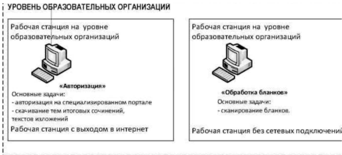
Рисунок 1. Архитектура и состав ПО

Схема ПО, используемого для проведения итогового сочинения (изложения), приведена на рисунке (см. Рисунок 1). На схеме приведены только новые или значительно модернизированные по сравнению со стандартной технологией проведения ЕГЭ модули и подсистемы.